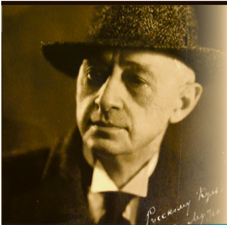
Nobelovac Ivan Aleksejevič Bunjin (1870-1953)