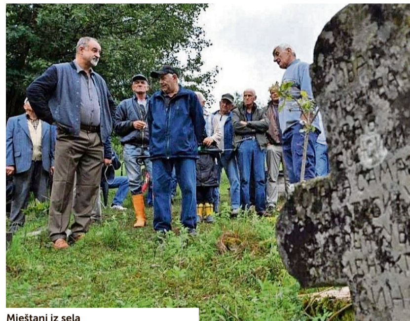
Mještani iz sela

Post Scriptum 4: U opkoljenom Sarajevu, u godinama 1992. – 1995., sjećao sam se posjete gospodina Roberta Rackmalesa, sve u strahu i drhtanju.